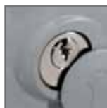
chiave di sblocco

Motoriduttore per cancelli fino a 800 Kg.