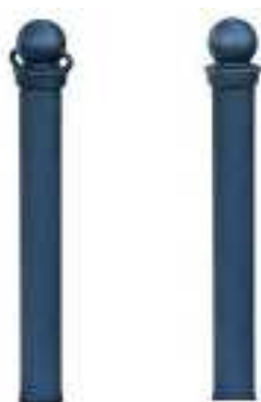
Murare senza flangia